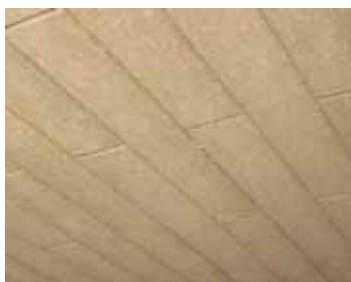
Теплоізоляційний шар фрезерованої ламелі із мінеральної вати